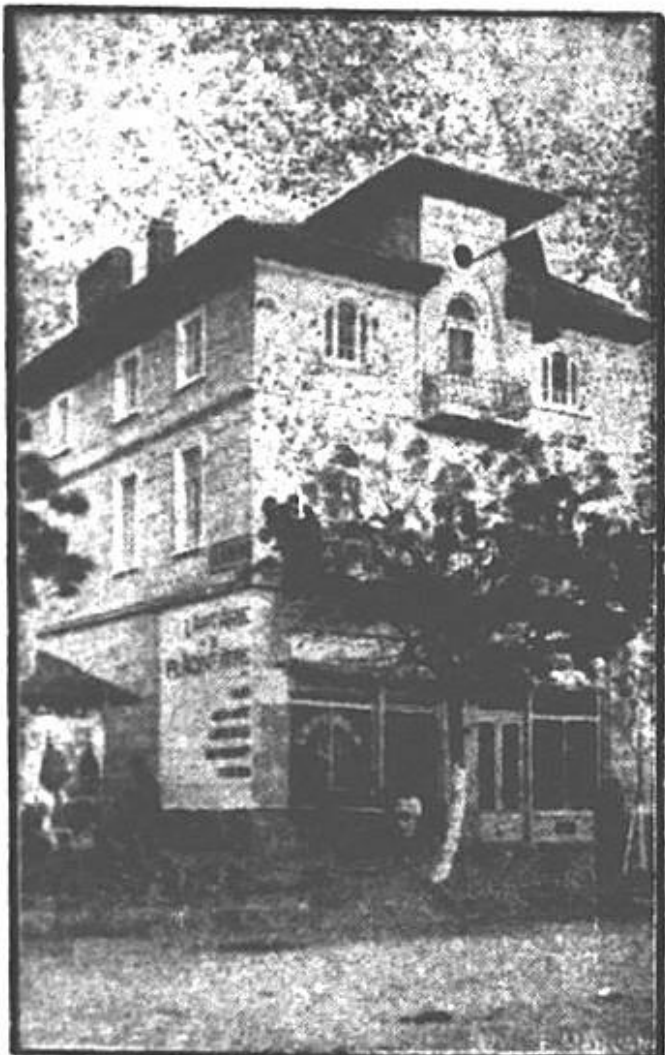
Carmen-Sylva — Vila Alexi

La Parterul Vilei ALEXI se află instalată renumita plăcintărie ALEXI MITRU Unde se servește cea mai delicioasă plăcintă cu Carne, Brânză și Mere. Bodegă și Restaurant